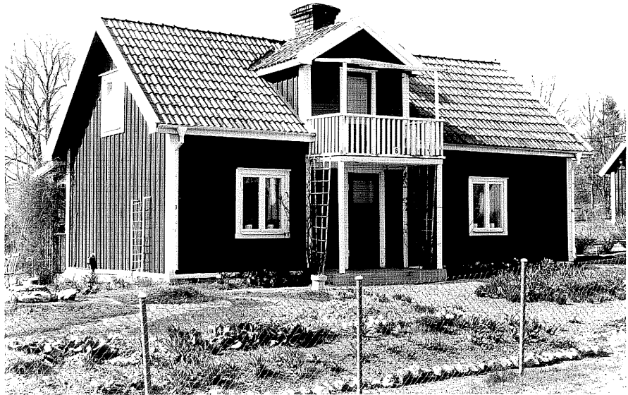
Bostadshus a fr.80, 10:30.

Ödeshög sn Ödeshög Södergården 8 6 Morlidsvägen 6. foto:M.Wikdahl,1978.