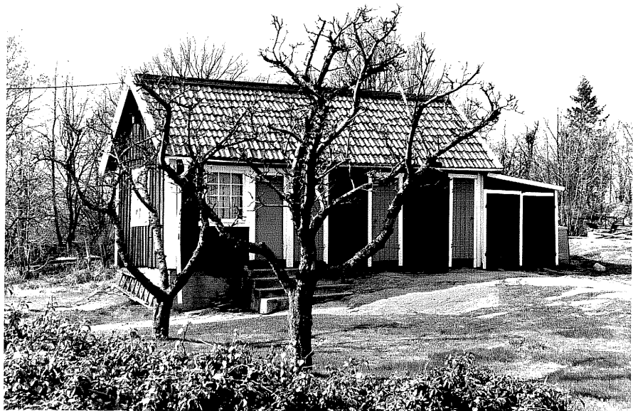
Uthus b fr.80, 10:31.