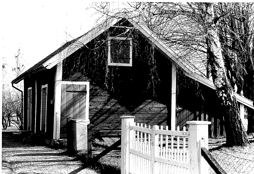
Uthus b fr. N, 14:8

Ödeshög sn Ödeshög Prästgård 5 1 Arrendatorsbostället foto: M. Wikdahl, 1978.