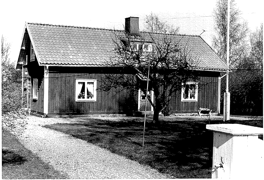
Bostadshus a fr.V, 14:7.

Ödeshög sn Ödeshög Prästgård 5 1 Arrendatorsbostället foto:M.Wikdahl,1978.