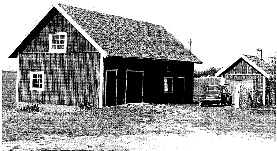
Uthas c och d fr.V, 14:9.