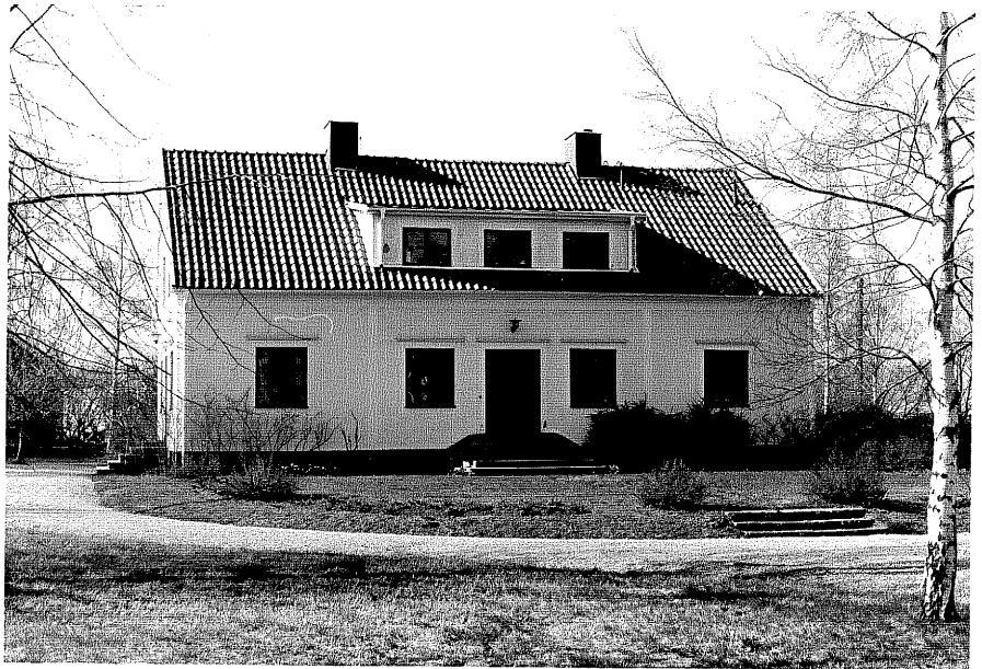
Prästgården fr.S, 14:11.

Ödeshög sn Ödeshög Prästgård 5 1 Mjölbyvägen foto :M.Wikdahl,1978.