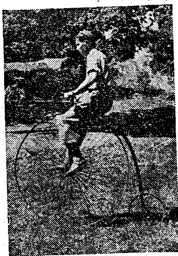
Under söndagens festligheter anordnas också cykeltävlingar, varvid bl. a. detta ekipage kommer att kunna beskådas.