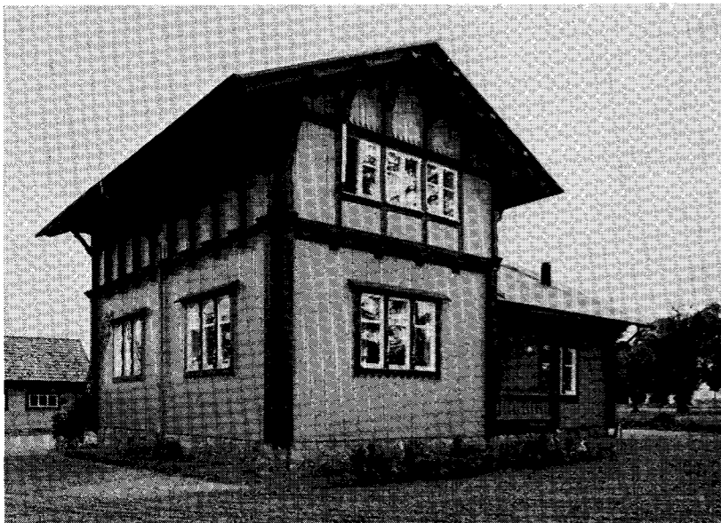
Slöjdvillan i Heda — beskriven i texten efter ett reportage 1889 — ser ut så här i dag.