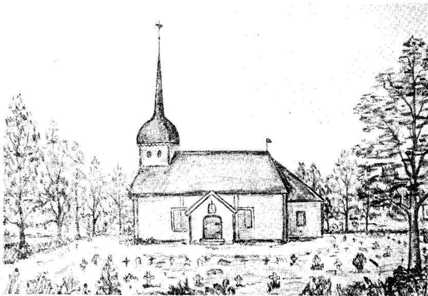
Trehörna gamla kyrka. Teckning av Olof Franke efter bild i nuvarande sakristia.