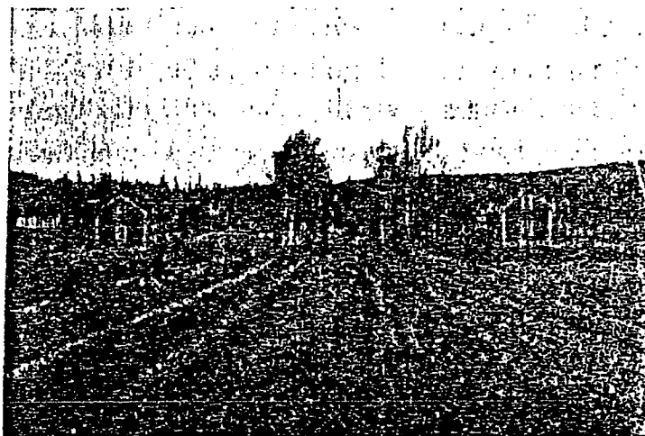
Fig. 1. Invid "mossavägen" ligga de små gårdarna tätt samlade. Omberg i bakgrunden.

Bebyggelsen omfattar för närvarande 75 större eller mindre småbruk, som med hänsyn till såväl läge som jordens karaktär kunna särskiljas i tvenne områden. Det västra, beläget mellan järnvägen och Omberg, där smågårdarna samlat sig sida vid sida liksom under bergets skydd alldeles invid gamla landsvägen Alvastra—Vadstena. Byggnaderna ha i regel kunnat uppföras på fast grund invid kanten av mossen. De små jordlotterna sträcka sig sedan rakt ut åt mossen till järnvägen och t. o. m. något däröver. Jorden till dessa kolonat utgöres av en mörk, fullständigt förmultnad lögstartorv. Detta område, som omfattar 21 småbruk, är det först bebyggda.