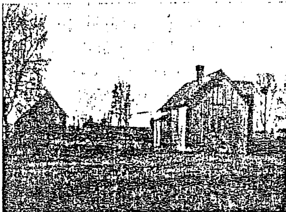
Fig. 4. Den "vänliga" björken växer in på husknutarna.

me så litet mera färg över de vanligen grå husen, skulle kolonatområdet te sig ännu vackrare och trevligare.