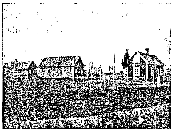
Fig. 5. Ett jämförelsevis stort kolonat. Boningshuset är rödmålat med vita knu- tar.

Det kan kanske in- tressera någon att höra vil- ket pris, som enbart jorden betalts med. För 8 kolonat med en areal från \frac{1}{4} till 5 ha har erlagts ett medel-