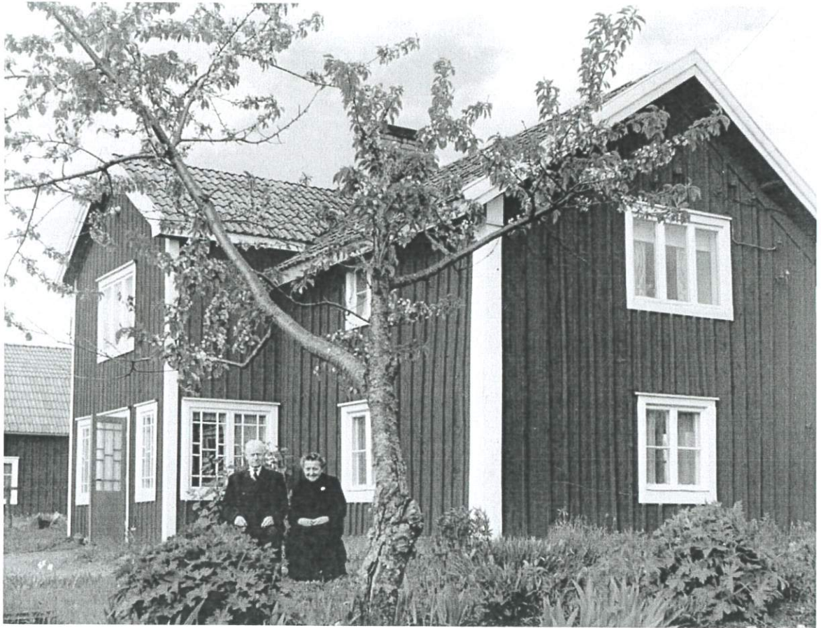
Carl Fredrik och Märta utanför Riset, slutet 1950-talet