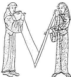
DET MEDELTIDA ALVASTRA

Välkommen till en vandring utmed en kulturstig där lämningar från det medeltida Alvastra ännu i dag finns synliga i landskapet. Stigen går förbi anläggningar som hade anknytning både till klostret och till Sverkersätten.