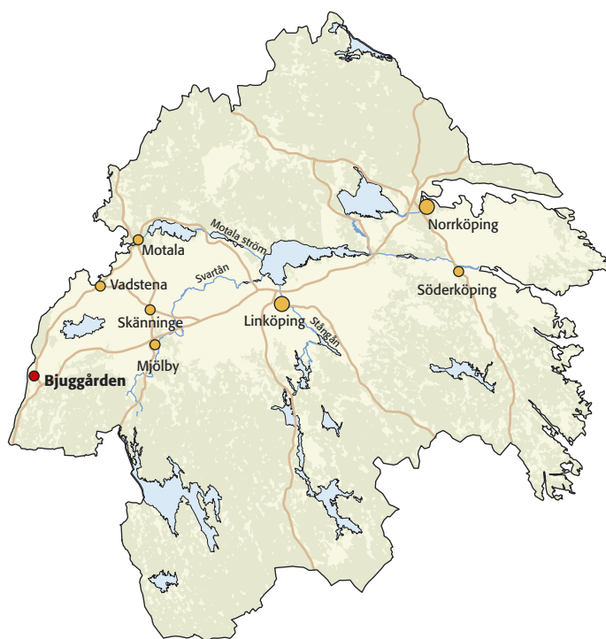
Fig 1. Karta över Östergötland med platsen för utredningen och slutundersökningen markerad.