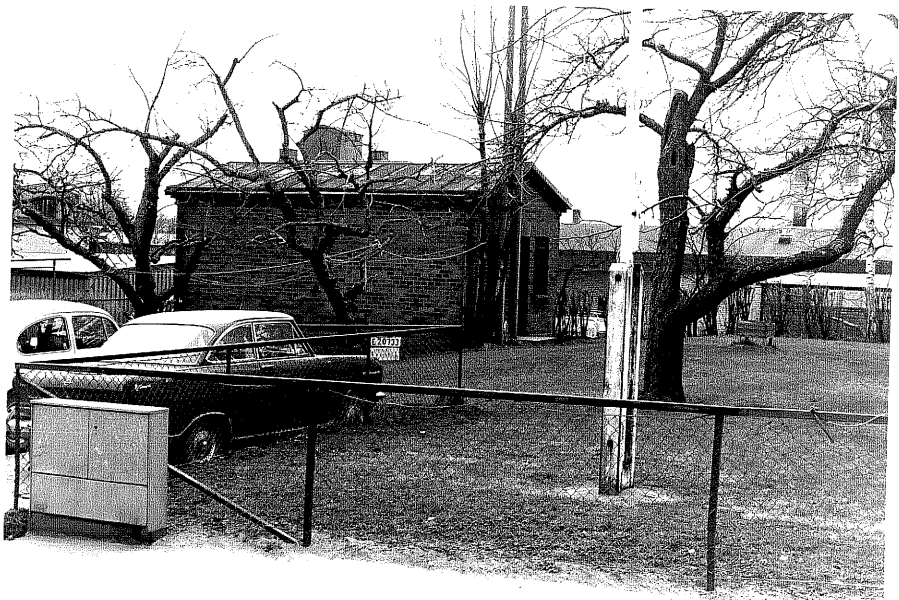
Uthus b (arkivet) fr.O,2:16.