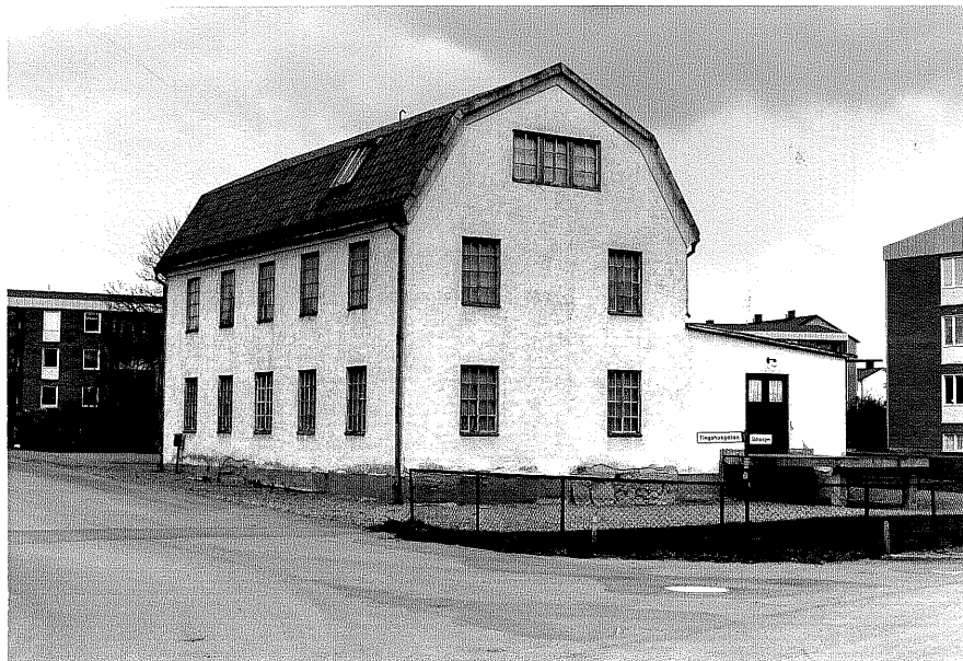
Gamla Triåfabriken fr.S, 9:11.

Ödeshög sn Druvan 5 Tingshusgatan foto:M.Wikdahl,1978.