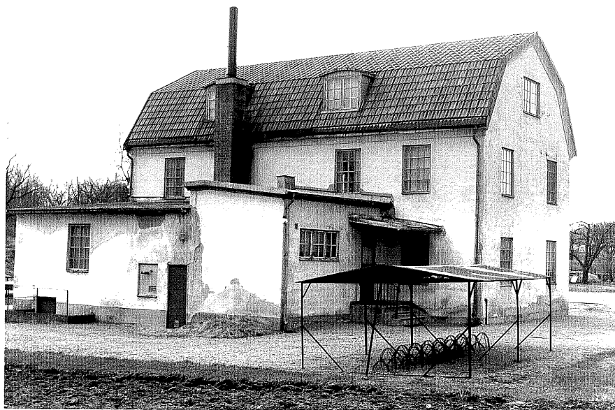
Gamla Triåfabriken fr.N, 9:12.