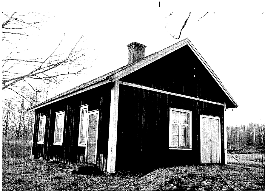
Neg. nr. T 06:06 Godtemplarlokalen från NO

Ödeshögs kommun Trehörna socken Elkeberg med Lassarp 1:5 Godtemplarlokalen