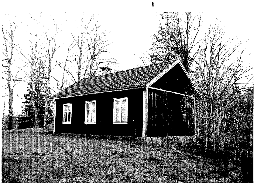
Neg. nr. T 06:05 Godtemplarlokalen från SV