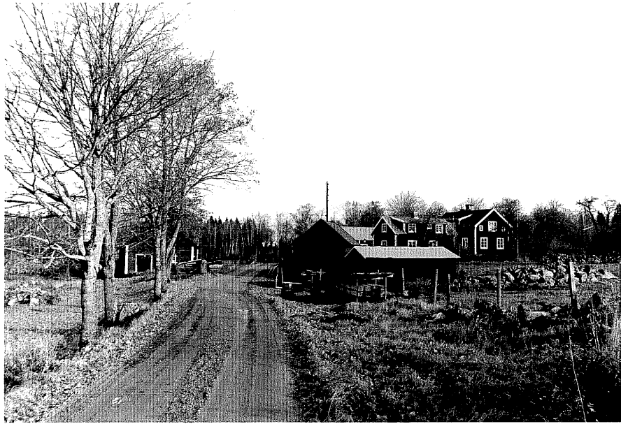
Neg. nr. T 06:04 Miljö från SV

Ödeshögs kommun Trehörna socken Elkeberg med Lassarp 1:5 Lassarp