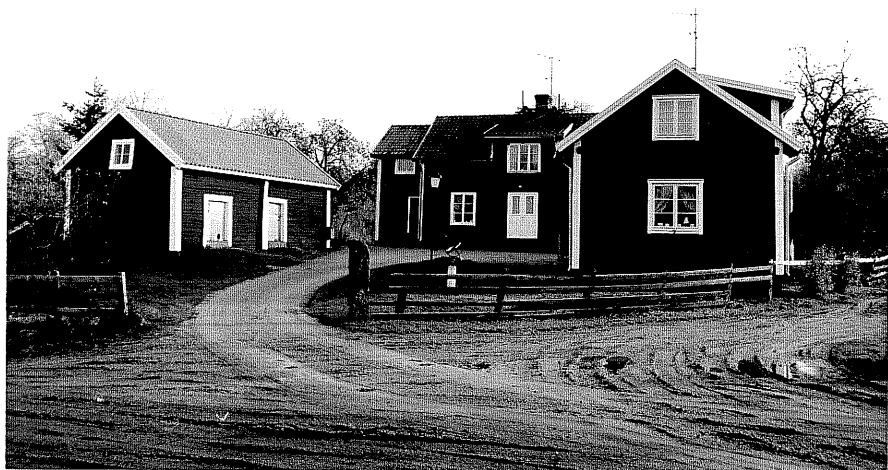
Neg. nr. T 06:01 Gårdsmiljö från SV