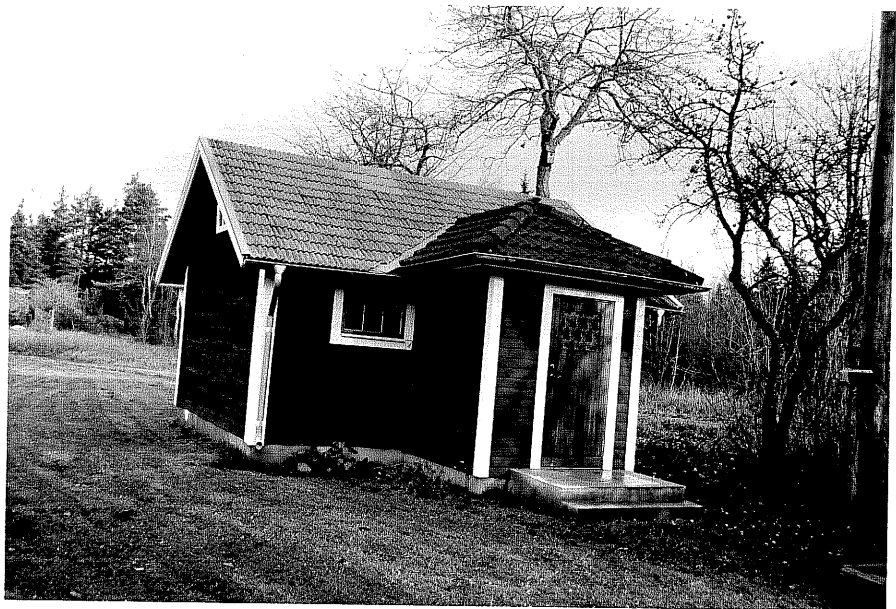
Neg. nr. T 06:10 Gäststuga från SV