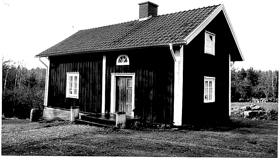
Neg. nr. T 06:09 Bostadshuset från NO