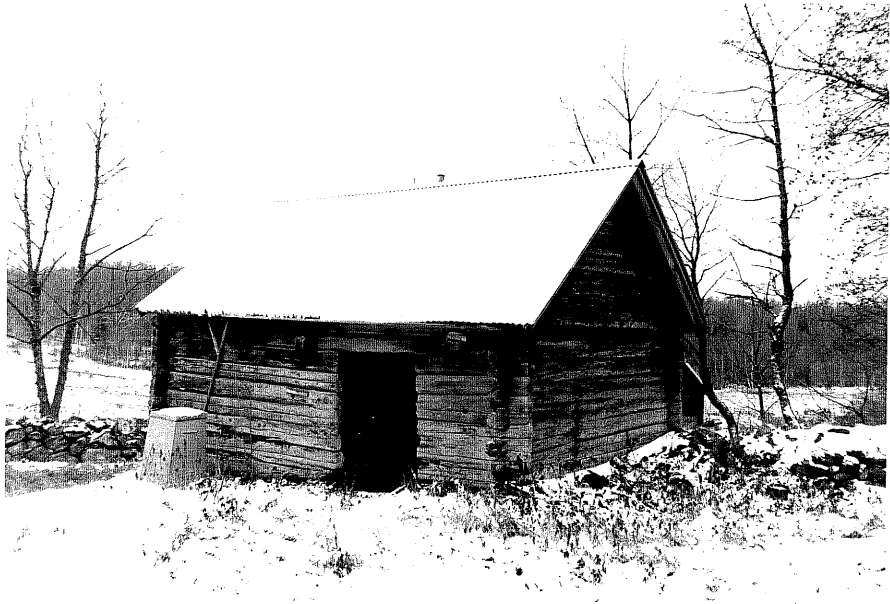
Neg. nr. T 10:07 Byggnad från NV