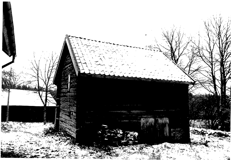
Neg. nr. T 10:06 Flygelbod till östra huset från V