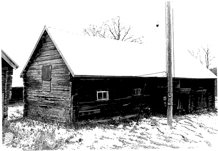
Neg. nr. T 10:08 Byggnad från NV