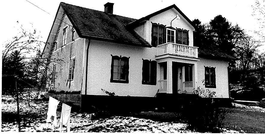
Neg. nr. T 10:04 Västra huset från SV