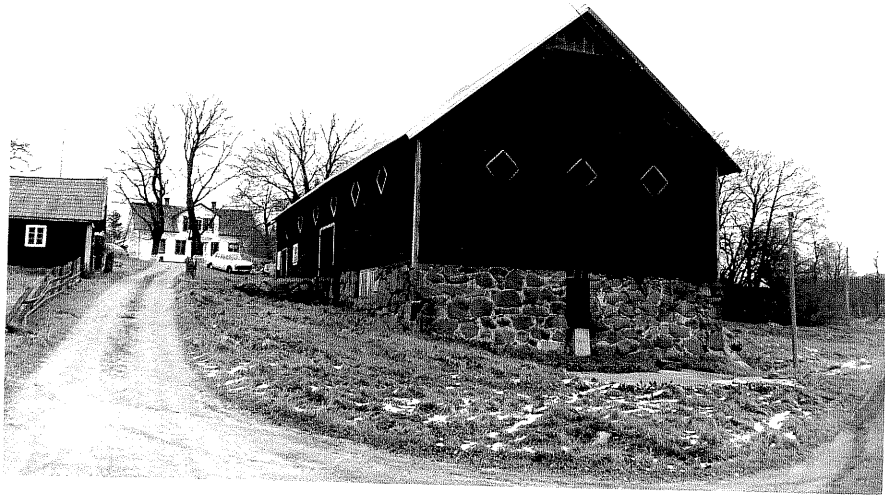
Neg. nr. T 10:17 Ekeberg med "nya" ladugården från S