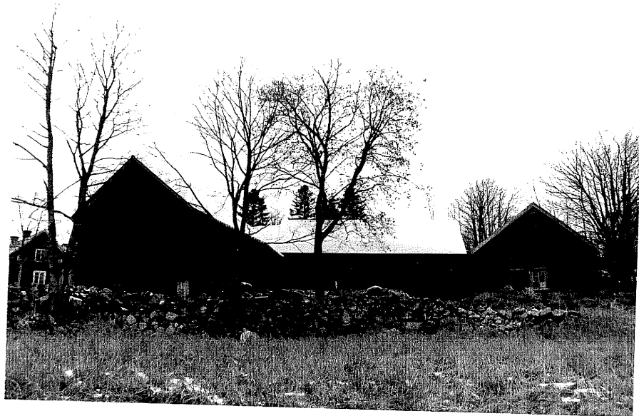
Neg. nr. T 10:15 Gamla ladugården från S