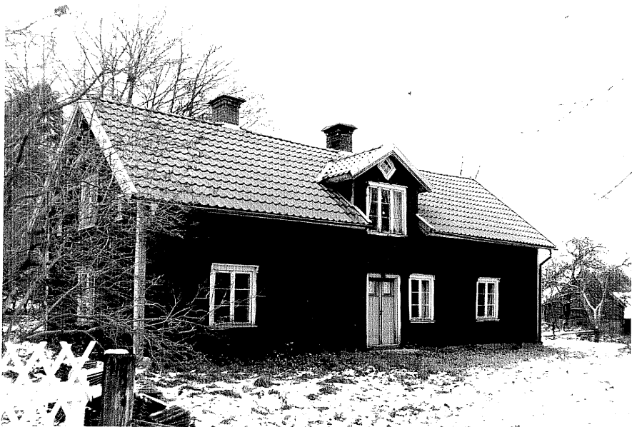
Neg. nr. T 10:05 Östra huset från SV