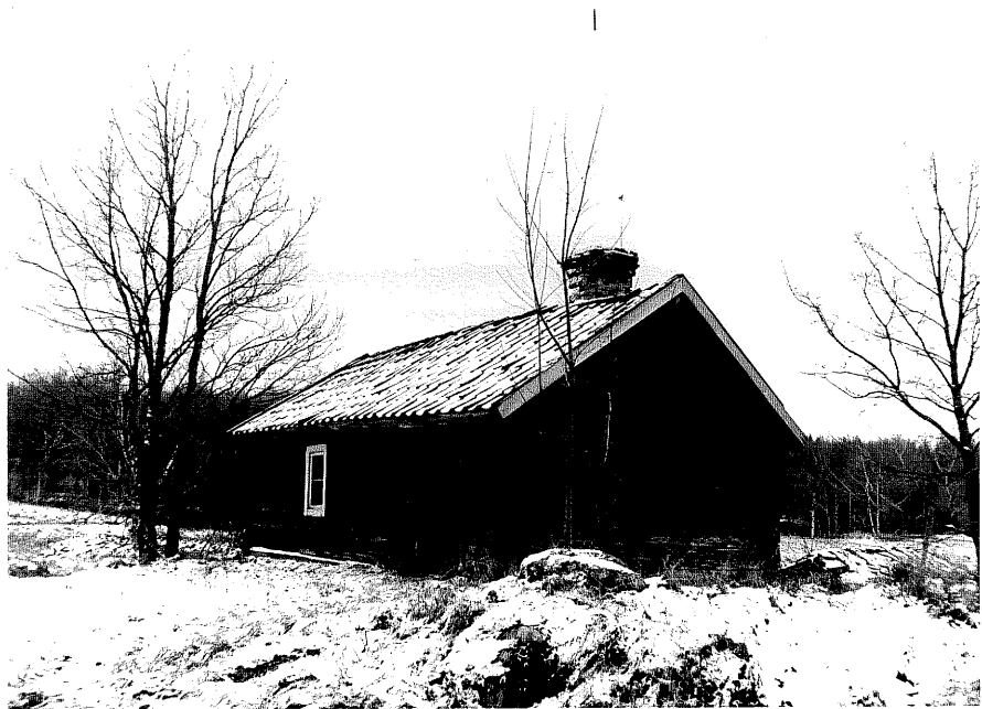
Neg. nr. T 10:14 Smedja från NV