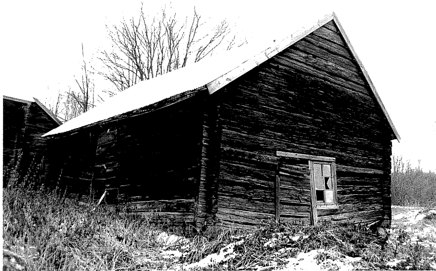
Neg. nr. T 10:10 Byggnad från SV