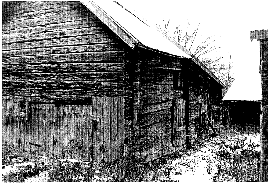
Neg. nr. T 10:09 Byggnad från V