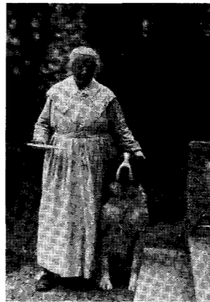
Tillsammans med hunden Gullan 1924.

Den 20 juni 1915 hölls ett stort möte på Visingsö för kvinnornas rösträtt med Ellen Key som föredragshållare. Stark nykterhetsvän medverkade Ellen Key vid flera sammanträden och kurser, bl. a. å Birgittadagen 1916 i Vadstena med föredrag om Heliga Birgitta. Vid de stora folkfesterna annandag pingst å Omberg talade hon ett flertal gånger och även i Ödeshög å logen I. O. G. T. Några gånger höll hon julotta i godtemp-