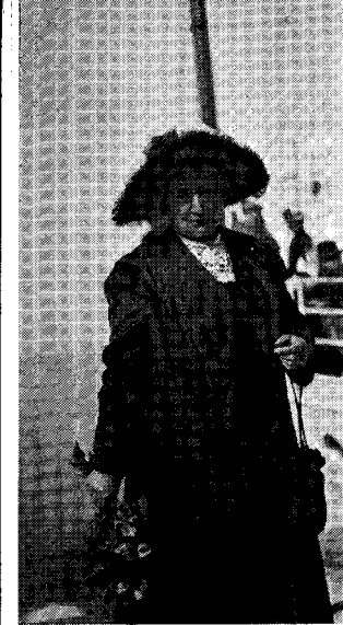
"Visingsö 20 Juni 1915, vid avresan från det kvinnliga rösträttsmöte, där E. K. höll föredrag", har Ellen Key skrivit på detta foto.

Den 25 juni (midsommardagen) 1911 var det invigningsfest å Strand med mat, sång samt tal av Ellen, och till vilken inbjudits samtliga, som haft någonting att göra med husets uppförande samt andra närboende. Och för att lyckönska sin goda vän Ellen kom redan första sommaren bl. a. kommunal- och socialpolitikern Anna Lindhagen och konstnären Oscar Björk från Stockholm, från bygden prins Eugen, Greta och Verner von Heidenstam samt från Jönköping konstnären John Bauer med maka.