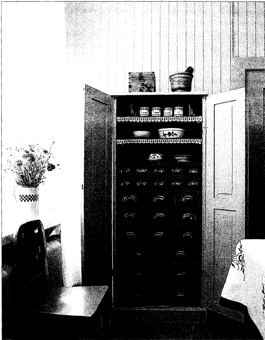
Det stora köket är målat i mjuka, gråblå färger och inrett med speciella hyllor och skåp för allehanda ting.

sällsynt goda relation – ”de älskade varandra så högt att de ej tyckas ha haft mycket ömhet att avvara åt barnen”, och behandlingen av barnen var sträng ”för att icke säga hård”. Barnen bodde – gossarna alltid och flickorna tidvis – i en flygel utom syn- och hörhåll för direkt föräldrauppsikt, och deras vård var överlämnad åt lejda händer.