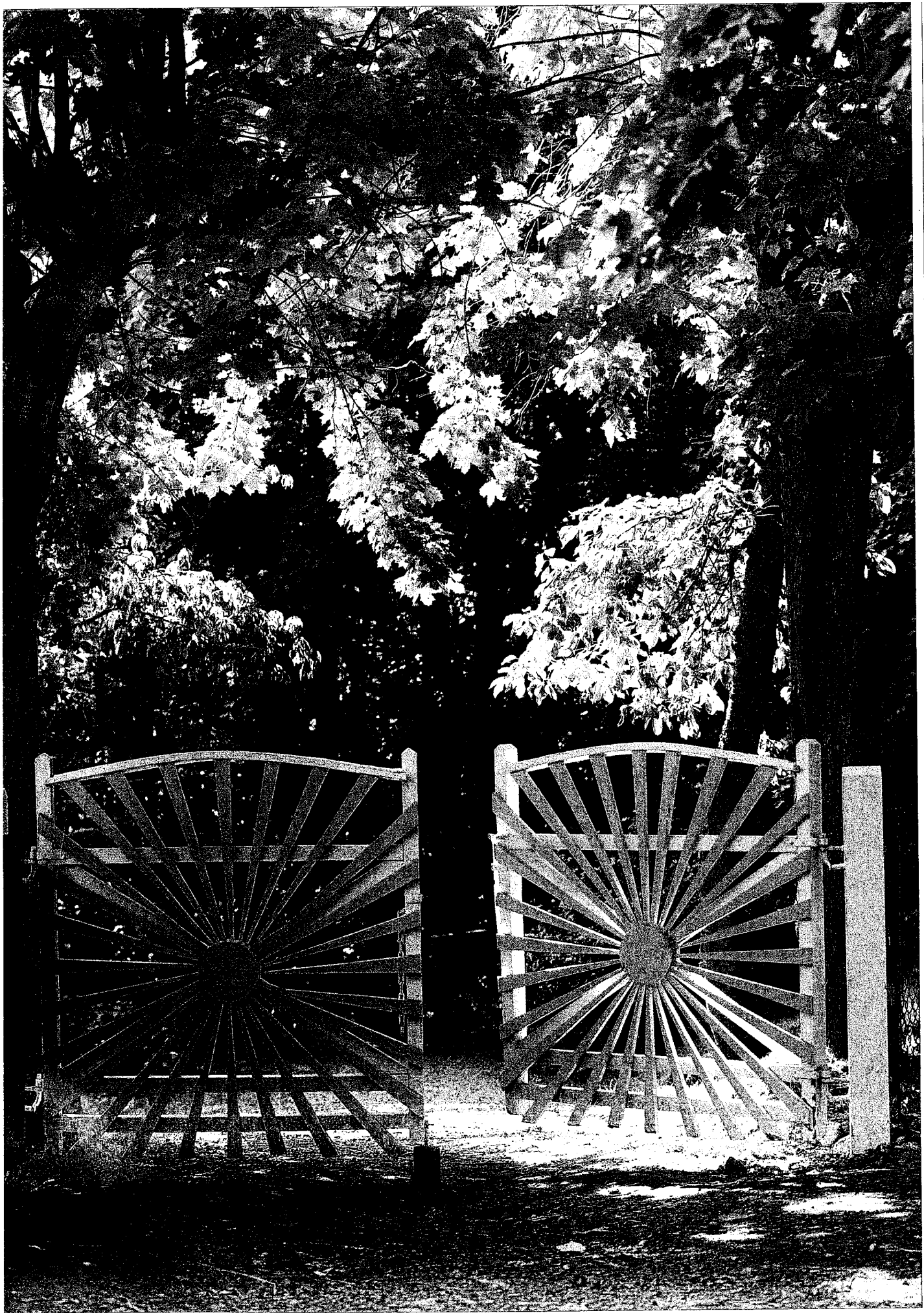
grindarna är solar och välkomnande.