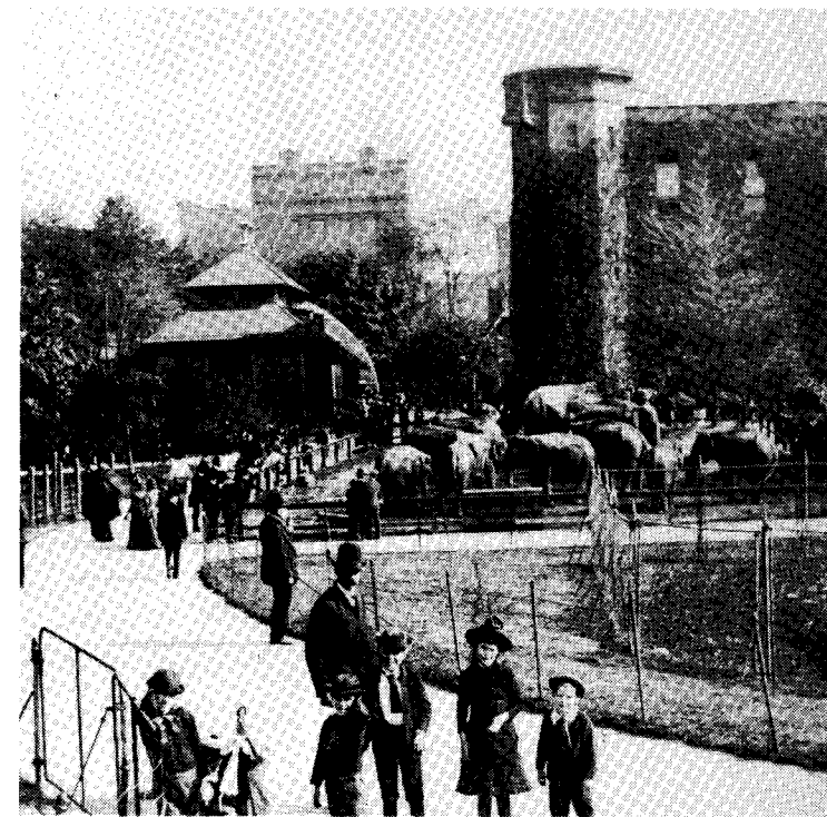
Ännu en turistbild: elefanterna i Central Park, New York