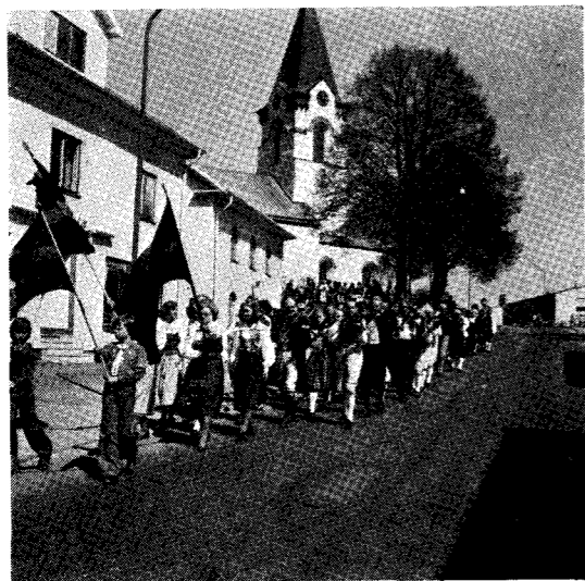
Spelmän på marsch från kyrkan vid den glansfulla spel- mansstämman i Ödeshög 19 maj 1974.