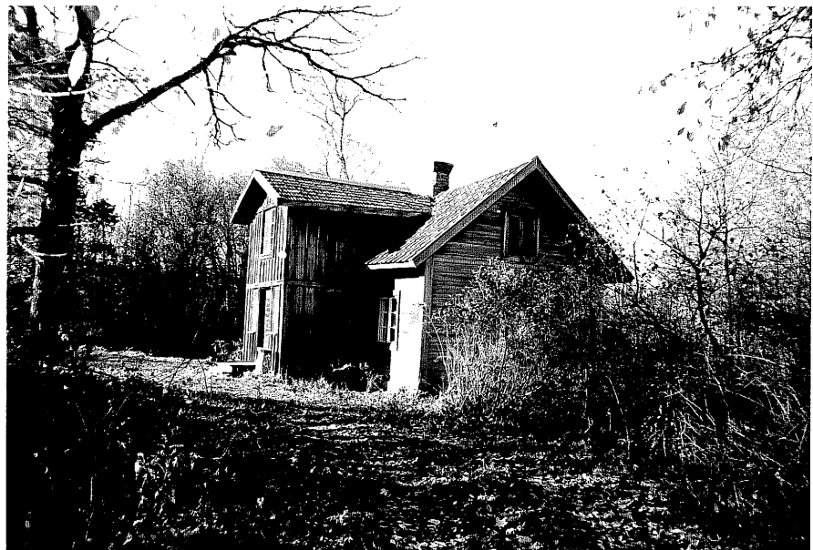
Neg. nr. T 02:34 Bostadshuset från N0