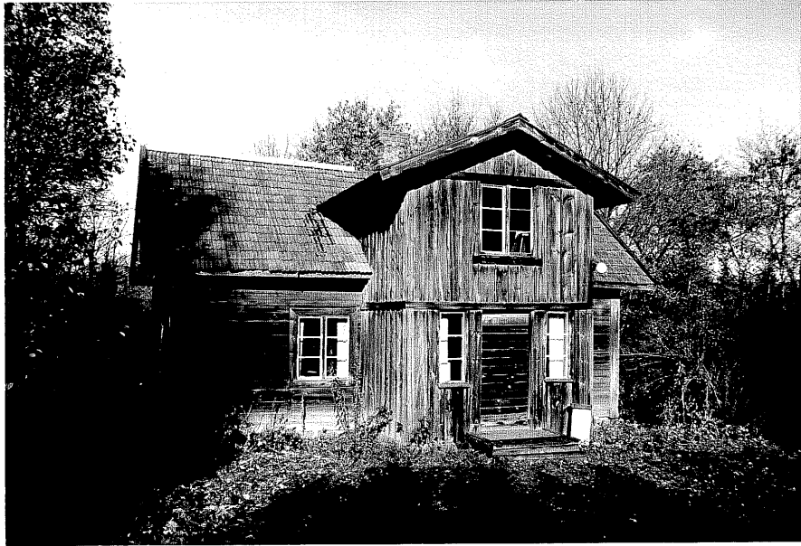
Neg. nr. T 02:36 Bostadshuset från S0

Ödeshög kommun Trehörna socken Fagerhult 1:2 Fagerhult