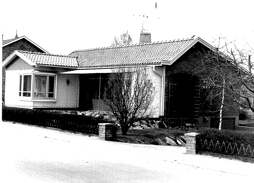
Bostadshus fr.80, 7:9.

Ödeshög sn Falkberget 13 Klubbgatan 11 foto:M.Wikdahl,1978.