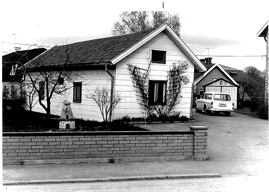
Uthus b fr.S, 7:11.