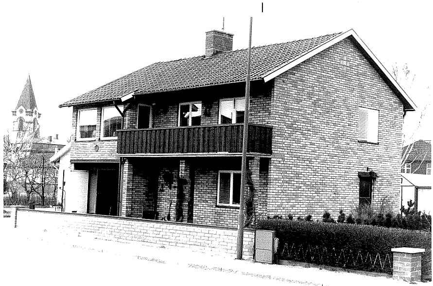
Bostadshus a fr.S, 7:10.

Ödeshög sn Falkberget 14 Klubbagan 9 foto:M.Wikdahl,1978.