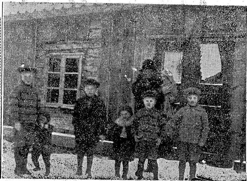
HÄR ÄR HELA FAMILJEN UTOM FAR SAMLAD, DEN ALLRA MINSTE PÅ MORS ARM.