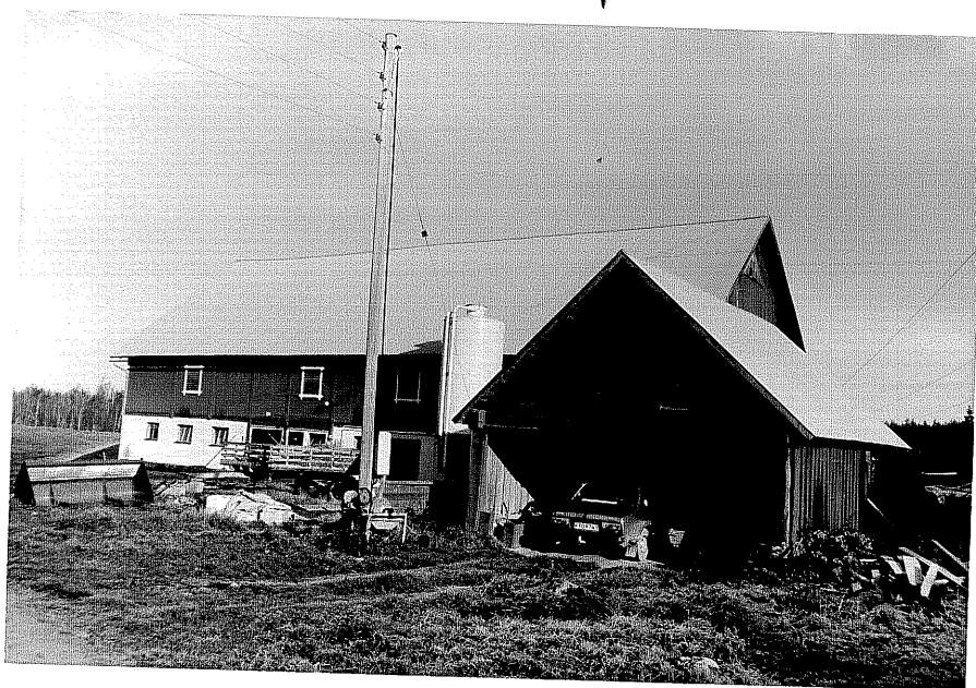
Neg. nr. T 04:10 Ekonomibyggnader från SV