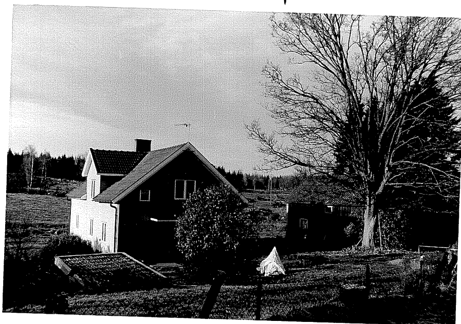
Neg. nr. T 04:11 Finnarp från O

Ödeshög kommun Trehörna socken Finnarp 1:1 Finnarp