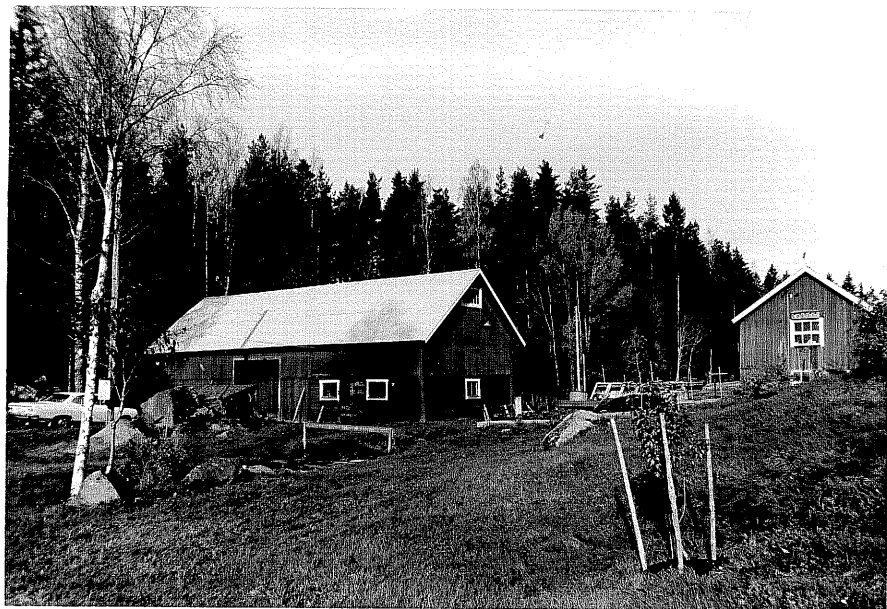
Neg. nr. T 04:17 Ekonomibyggnader från SO