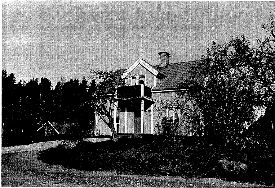
Neg. nr. T 04:16 Bostadshuset från SO

Ödeshög kommun Trehörna socken Finnarp 1:2 Harhult