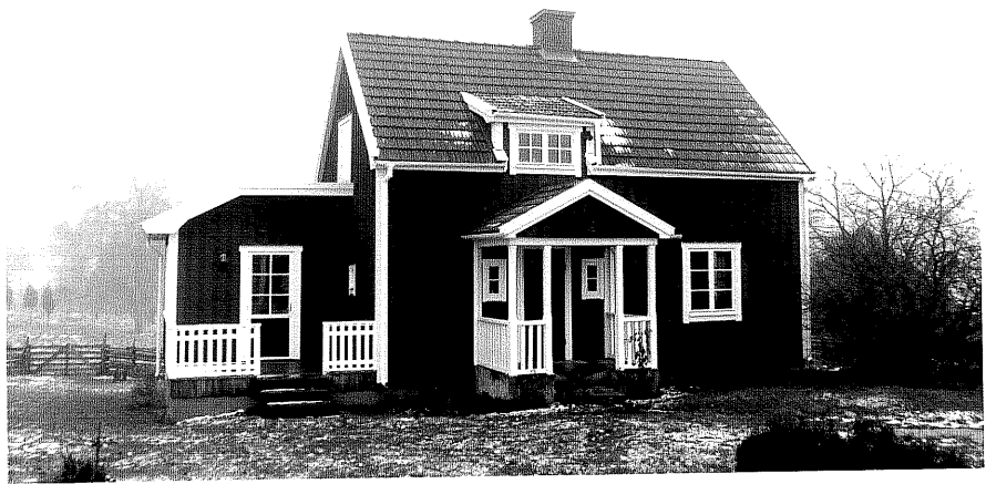
Neg. nr. T 11:29 Bostadshuset från NO

Ödeshögs kommun Trehörna socken Fivlefall 1:4 Fifflefall, södra huset