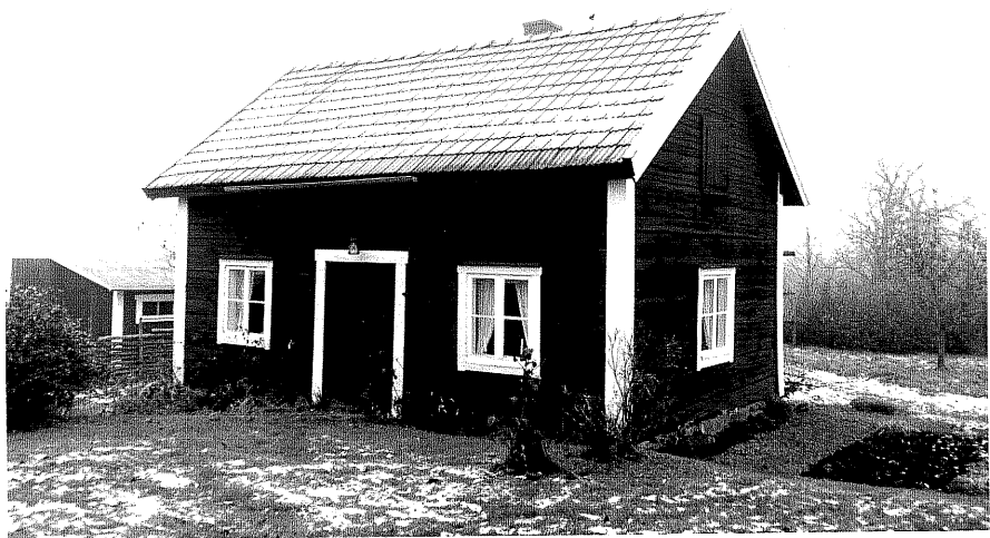
Neg. nr. T 11:30 Bod från SV