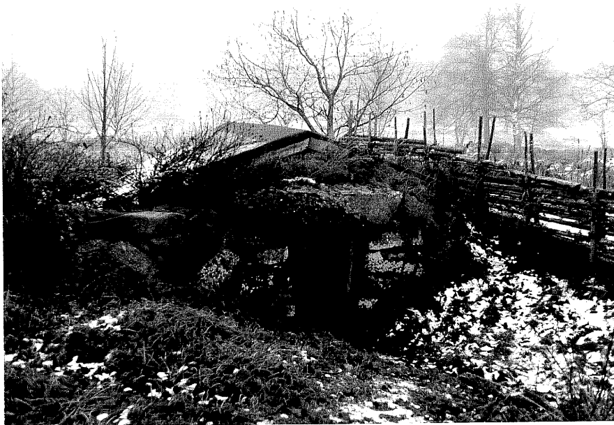
Neg. nr. T 11:31 Jordkällare från V

Ödeshögs kommun Trehörna socken Fivlefall 1:4 Fifflefall