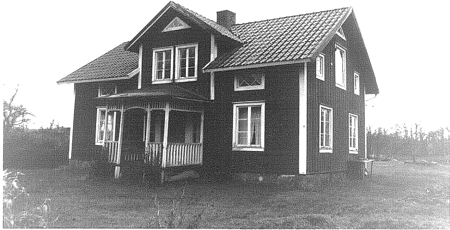
Neg. nr. T 14:25 Drottningstorp från NO

Ödeshögs kommun Trehörna socken Fliseryd 2:1 Drottningstorp