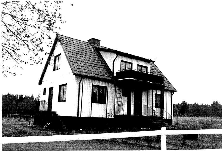
Neg. nr. T 14:30 Stubbhemmet från SV

Ödeshögs kommun Trehörna socken Fliseryd 2:1 Stubbhemmet