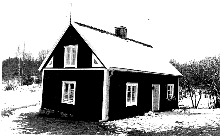
Neg. nr. T 09:17 Södra huset från N0