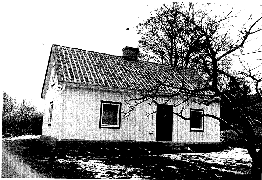
Neg. nr. T 09:16 Norra huset från S0

Ödeshögs kommun Trehörna socken Fliseryd 1:1