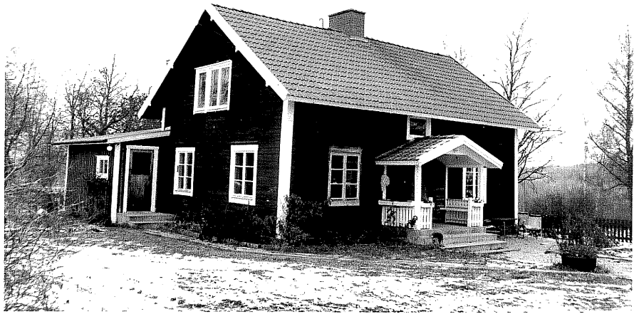
Neg. nr. T 09:10 Bostadshuset från S

Ödeshögs kommun Trehörna socken Flugebo 1:3 Sörgården