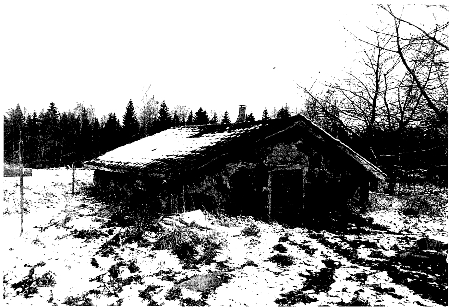
Neg. nr. T 09:09 Jordkällare från N