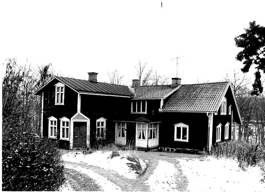
Neg. nr. T 09:01 F.d affären från SV

Ödeshögs kommun Trehörna socken Flugebo 1:4 F.d affären