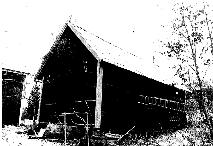
Neg. nr. T 09:02 Bod från NO