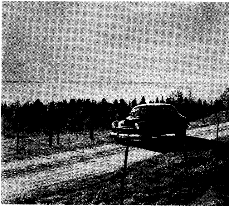
Från Holkabergets höjder har man en bänförande utsikt över Vättern.

se vad komma skulle samt utföra underbara ting. En uggle över staldörren skyddade för maran. Hästarna troddes vara särskilt utsatta för denna och stodo ofta på morgonen genomsvetta efter en natts marritt. Man trodde att djuren kunde tala under julnatten. En bonde beslöt en gång, att den natten gå till ladugården för att få höra vad djuren talade om. En gammal ko sade med sorgsen stämma: "Det blir nog flera av oss som måste dö i vinter. Jag har varit med om nödår och vet hur det kan gå." Tjuren ville i alla fall tala tröstens ord och påminde om, att det i halmens ax ännu fanns några korn kvar. Bonden, som med sin familj saknade bröd, beslöt tröska halmerna, men detta slutade olyckligt. Den gamla kon och flera med den dukade under.