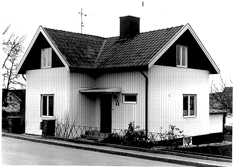
Bostadshus a fr.50, 15:17.