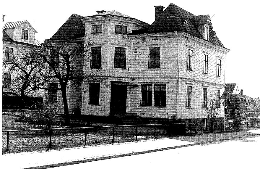
Bostadshus a fr.NO, 1:1.