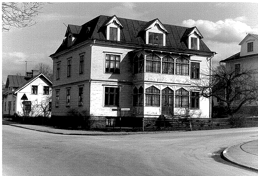
Bostadshus a fr.NV, 1:0.

Ödeshög sn Fridtjuv Berg 1 Järnvägsgatan 6 foto:M.Wikdahl,1978