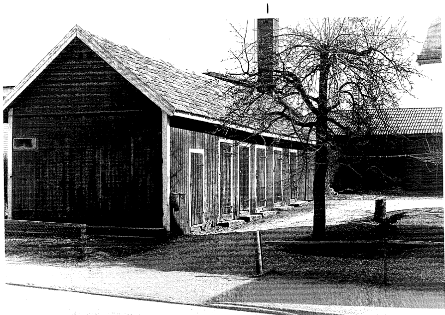
Uthus b fr.NV, 1:2