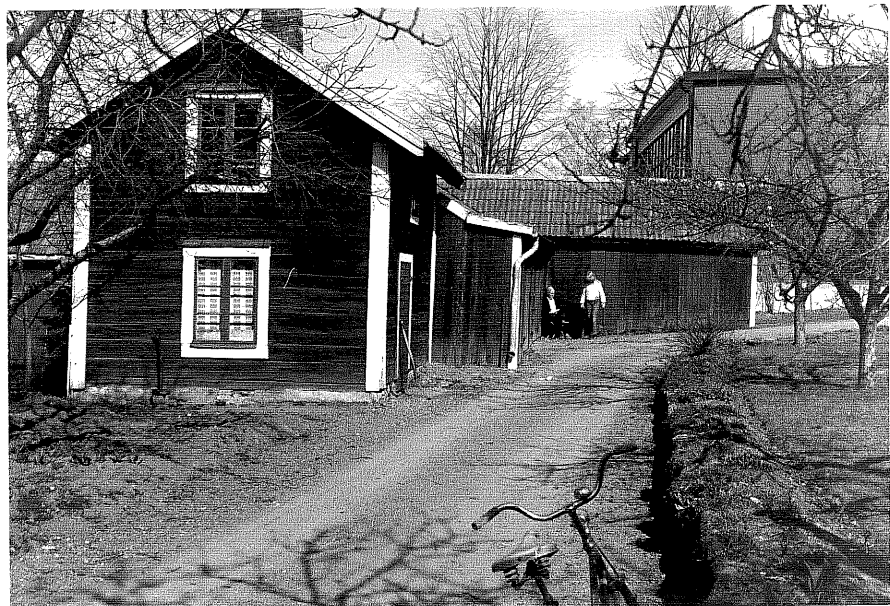
Uthus c fr. V.,1:6.