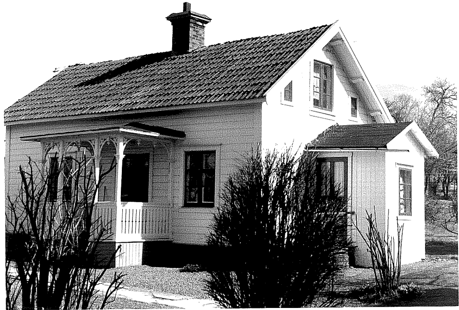
Gårdshus b fr.NV.,1:7.

Ödeshög sn Fridtjuv Berg 2 Järnvägsgatan 8 foto:M.Wikdahl,1978