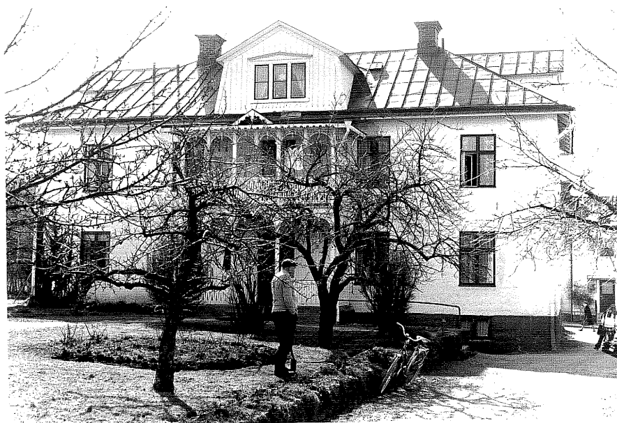
Bostadshus a fr. 0. 1:5