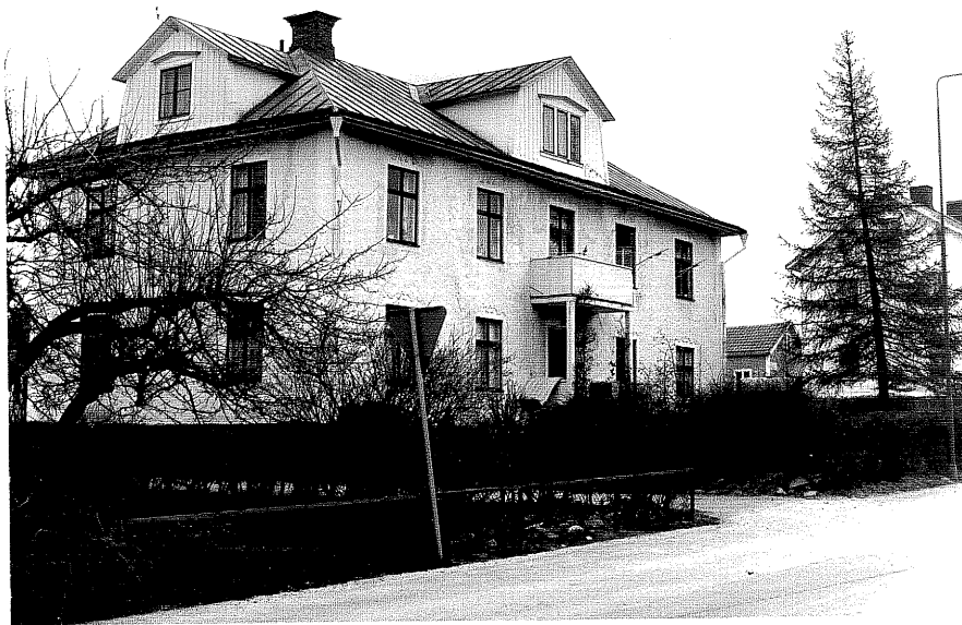
Bostadshus a fr.NV. 16:22

Ödeshög sn Fridtjuv Berg 2 Järnvägsgat. 8 foto:M.Wikdahl,1978