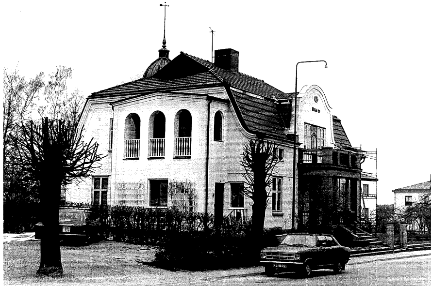
Bostadshus a fr.60,17:16.

Ödeshög sn Fridtjuv Berg 7 Nygatan 9 foto:M.Wikdehl,1978.