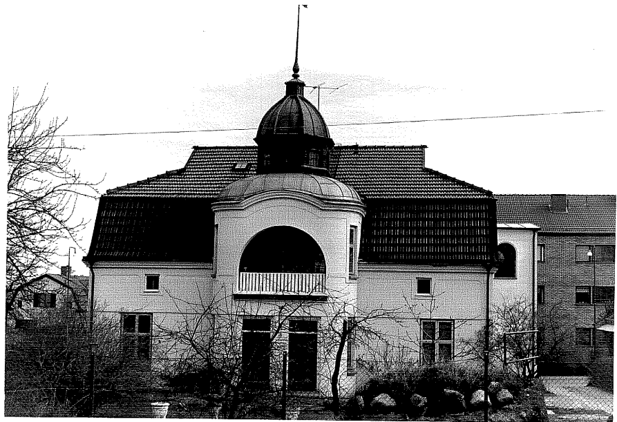
Bostadshus a fr.V,1:20.