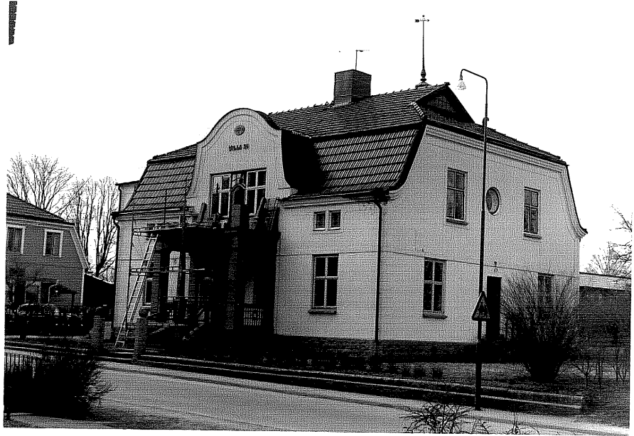
Bostadshus a fr. NO,1:18.

Ödeshög sn Fridtjuv Berg 7 Nygatan 9 1978