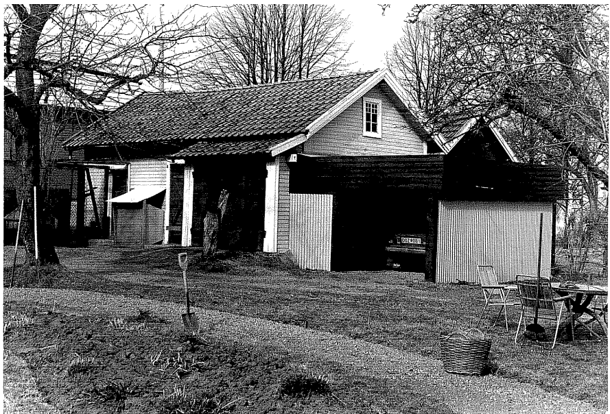
Gårdshus och garage fr.S0, 1:17