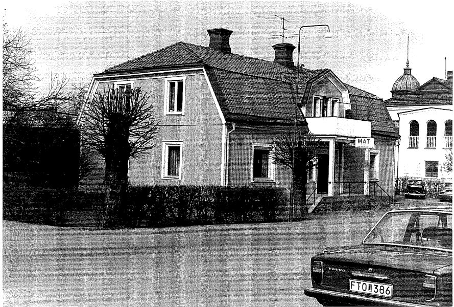
Bostadshus a fr.S0 ,1:16

Ödeshög sn Fridtjuv Berg 8 Nygatan 7 foto:M.Wikdahl,1978