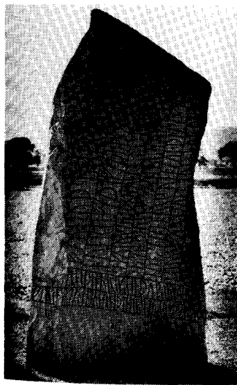
Ingvaldsättningarna, som odlade ny mark i Ingvaldstorp, nämns på Rökstenens baksida, upp och ner längst ner till vänster

Även om ordet torp oftast givits tolkningen nyodling så har torpets storlek, funktion och karaktär skiftat. Lägst i anseende stod backstugan. Därefter ökade anseendet hos dagsverkstorp (eller jordstorp, som de också kallades) och hantverkstorp. Högst stod soldattorpen.