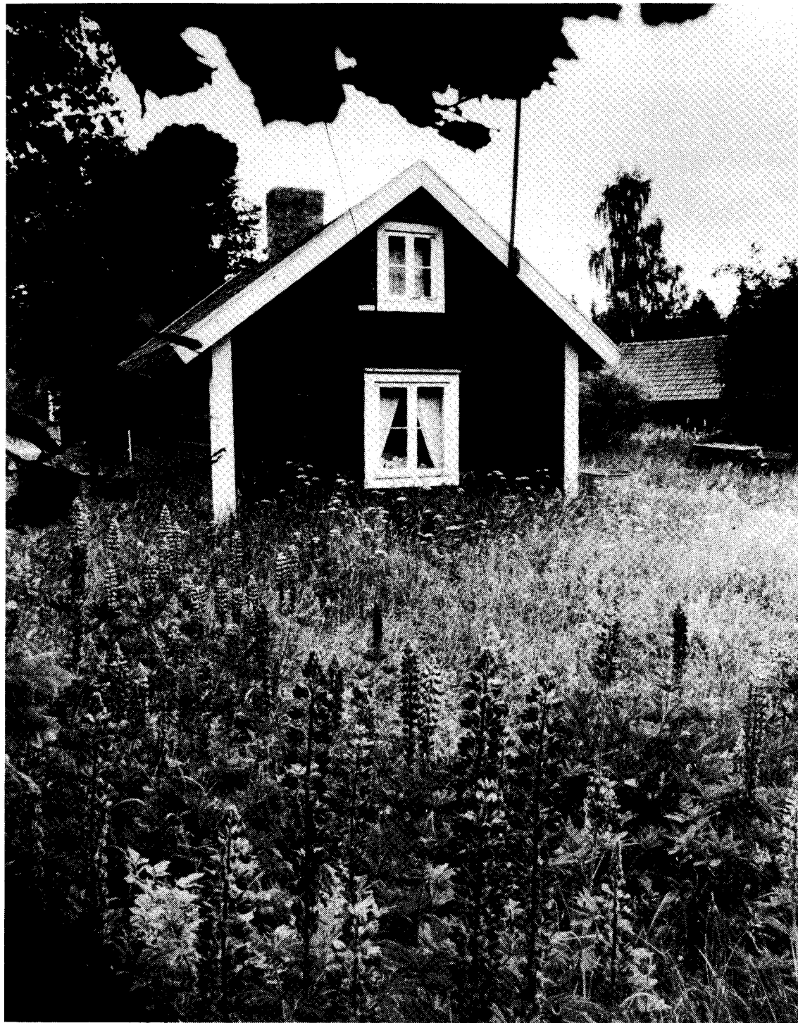
Kärbo, ett av 64 torp som inventerades i Svanshals socken t o m 1988. Då återstod ett 40-tal att söka upp, de flesta kvar bara som grunder