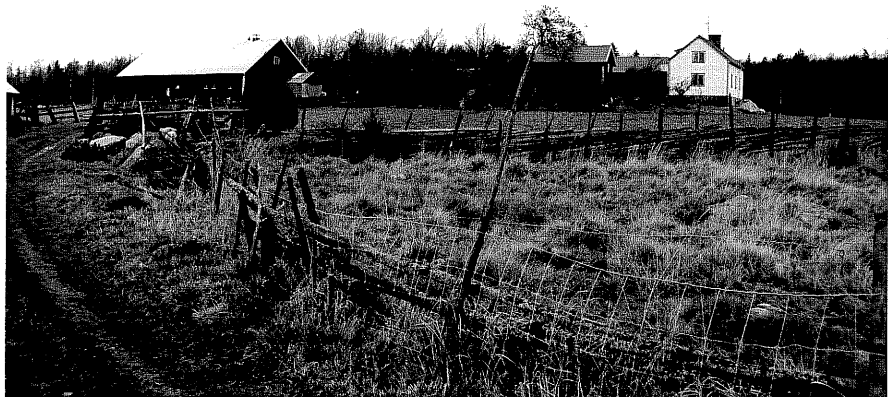
Neg. nr. T 06:14 Miljö från SO