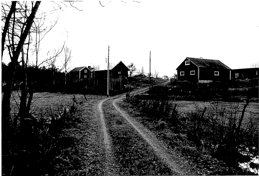
Neg. nr. T 06:10 Miljö från NV

Ödeshög kommun Trehörna socken Fågeltorp 1:1 Fågeltorp