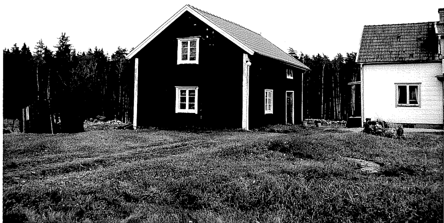
Neg. nr. T 06:12 Flygelbyggnaden från SV