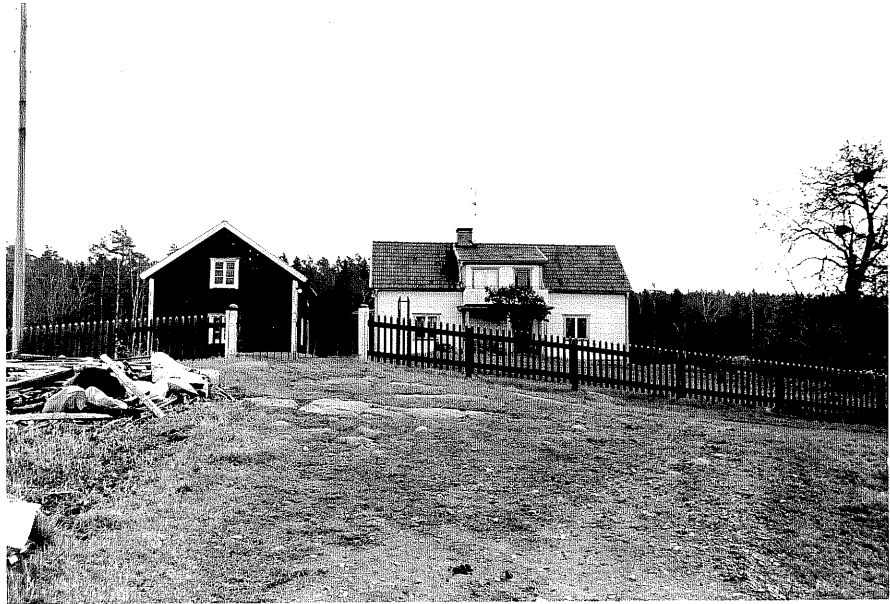
Neg. nr. T 06:11 Gårdsmiljö från V