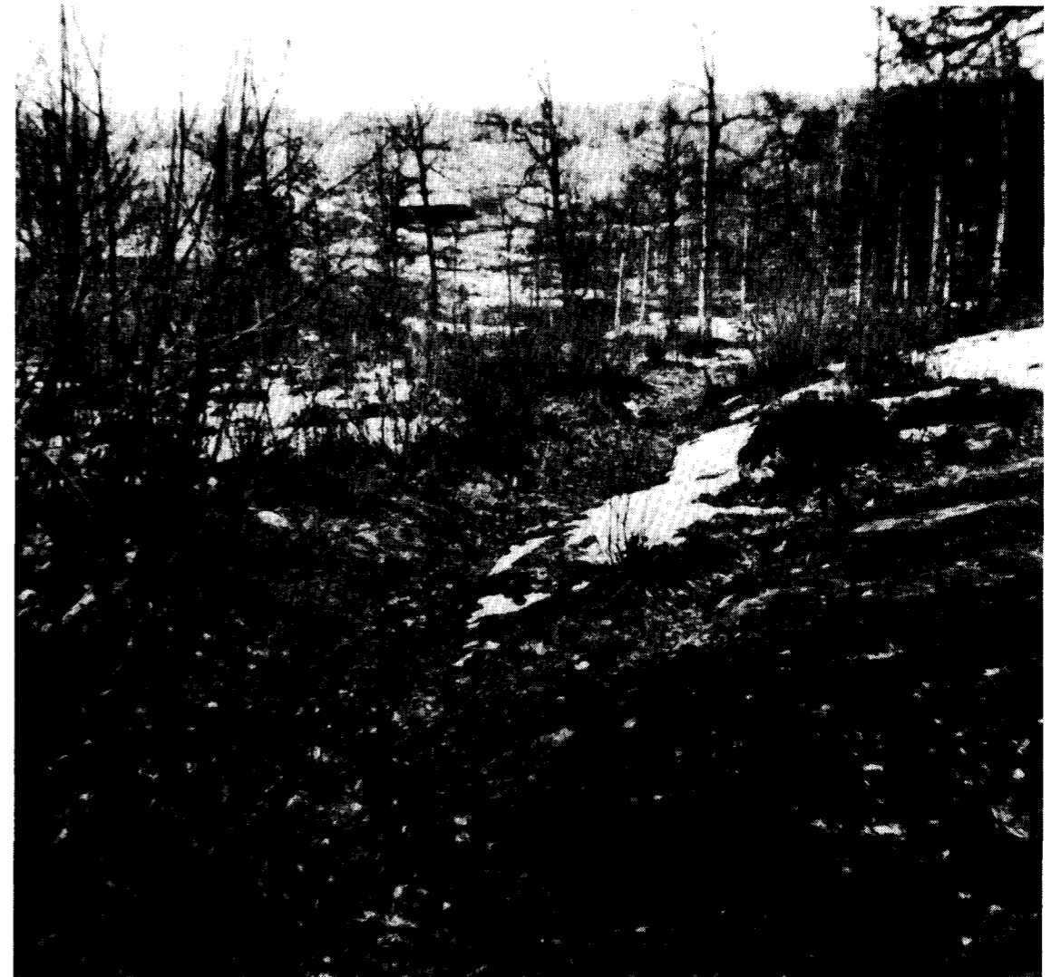
Den gamla ridstigen öster om nedersta Smessan. I bakgrunden Erikslunds ladugård vid nuvarande Tranåsvägen

”Hon må från utgångspunkten Alvastra tagit vägen över vare sig Stora Åby eller Rök och Hejla backe. En gång passerade hon med sina följeslagare Trehörnasjön i det inre av Holaveden och färdades vidare nu följande den urgamla ridstigen...”