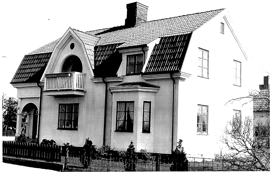
Bostadshus a fr.NV, 12:15.

Ödeshög sn Grenadjären 1 Storgatan 61 foto:M.Wikdahl, 1978.