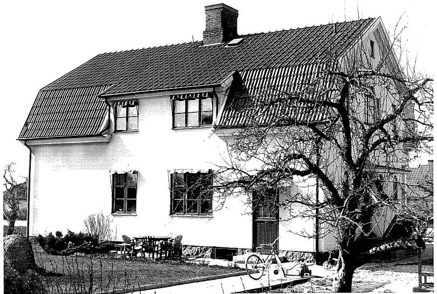
Bostadshus a fr.NO, 12:14.