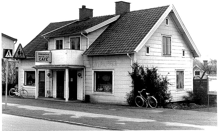
Affärs och bostadshus a fr.NV, 5:3.

Ödeshög sn Gripen 1 Storgatan 33 1978.