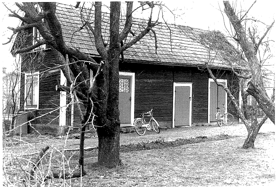
Uthus b fr. SO, 5:2.