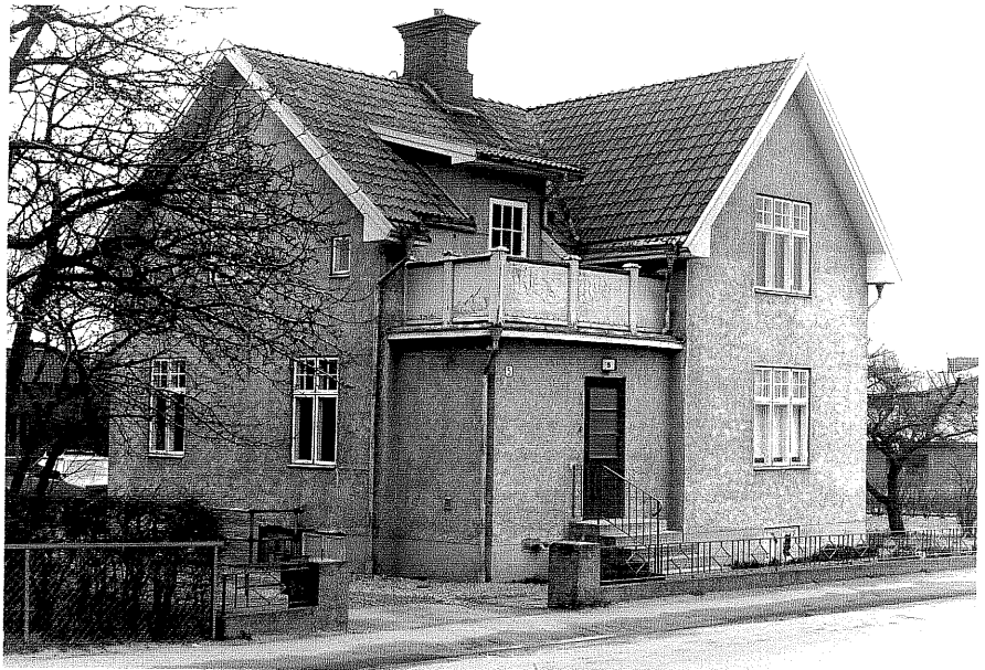
Bostadshus a fr.NV, 5:22.

Ödesög sn Gripen 10 Tranåsvägen 5 foto:M.Wikdahl,1978.