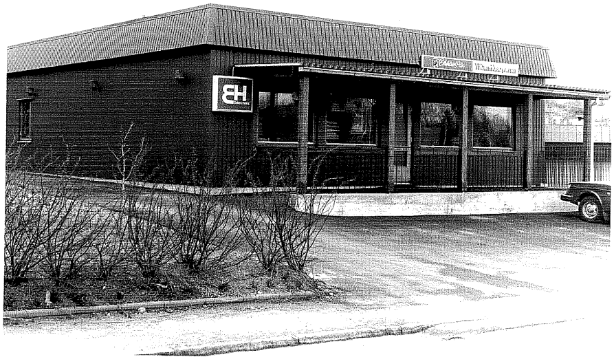
Affärslokal b fr.SV, 5:21.

Ödeshög sn Gripen 10 Tranåsvägen 5 foto:M.Wikdahl,1978.