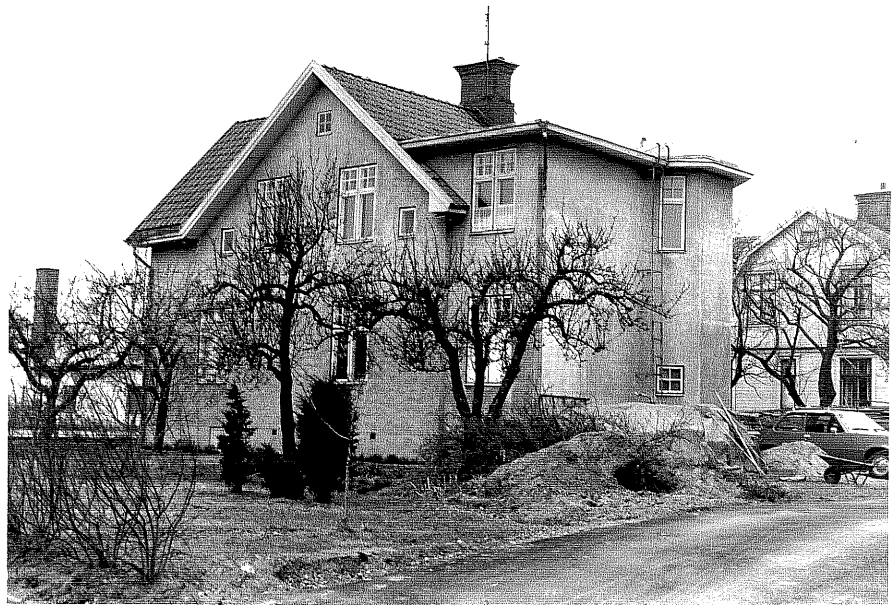
Bostadshus afr. NO, 5:25.