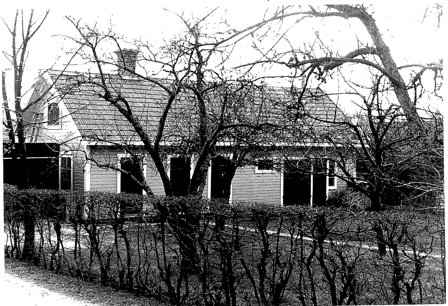
Uthus b fr. NV, 16:1.