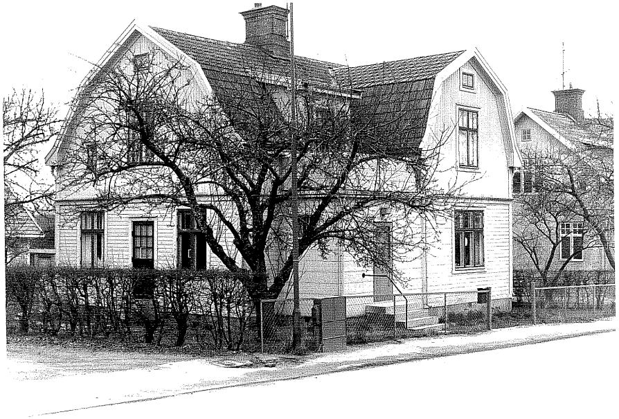
Bostadshus a fr. NV, 5:24.

Ödeshög sn Gripen 11 Tranåsvägen 3 foto:M.Wikdahl,1978.