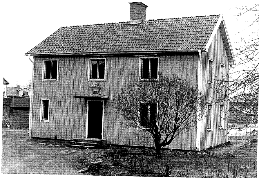
Bostadshus b fr.NV, 5:7.