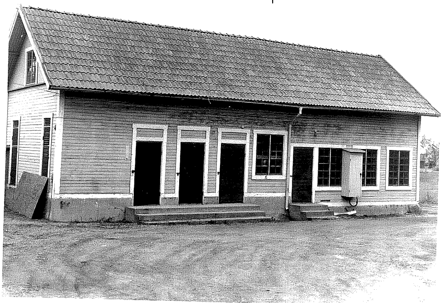
Uthus c fr.V, 5:6.