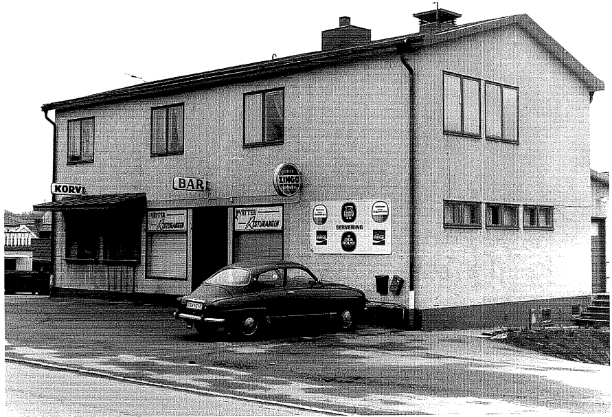
Affärs och bostadshus a fr.NV, 5:5.

Ödeshög sn Gripen 2 Storgatan 31 1978.