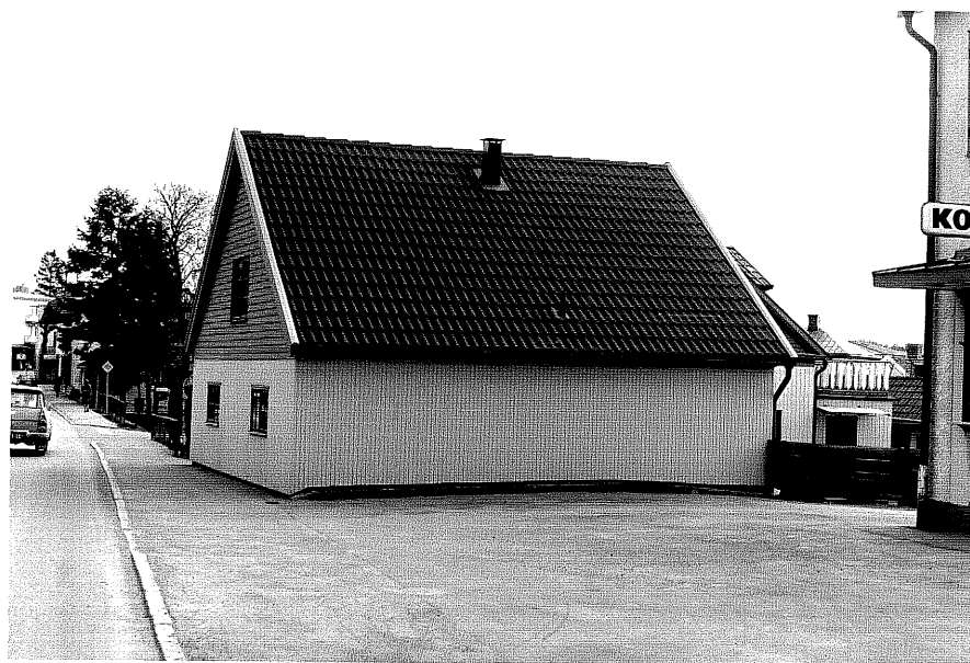
Bostadshus b fr.S, 15:36.