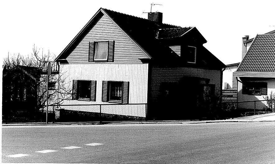
Bostadshus a fr.NO, 15:35.

Ödeshög sn Gripen 3 Storgatan 29 foto:M. Wikdahl, 1978.