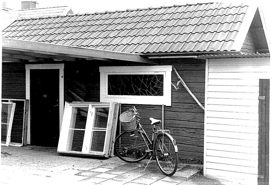
Uthus c fr. NV, 5:8.