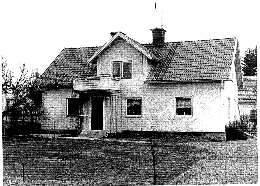
Bostadshus a fr.SV, 5:12.