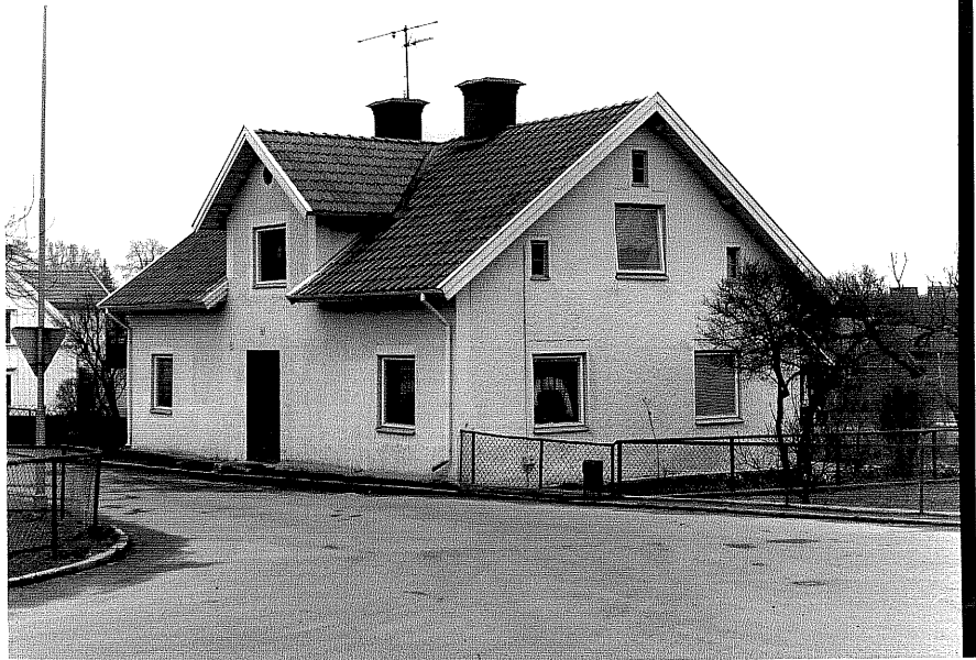
Bostadshus a fr.N, 5:11.

Ödeshög sn Gripen 4 Smedjegatan 4 foto:M.Wikdahl,1978.