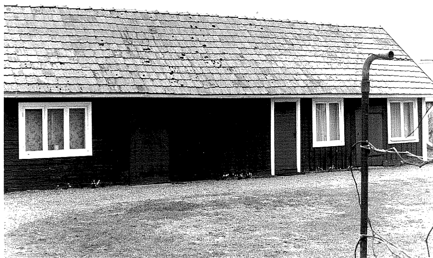
Uthus c fr.N, 5:14.