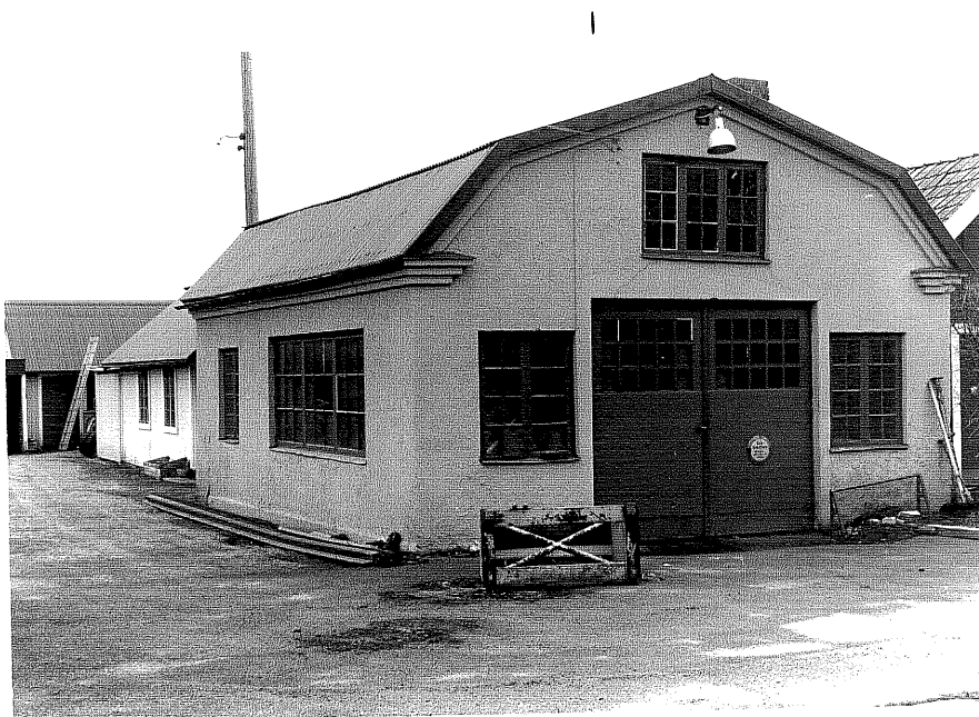
Smidesverkstad fr. O, 5:15.