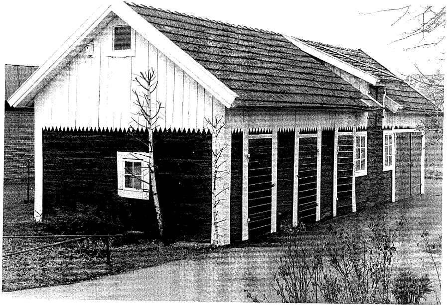
Uthus b fr. SO, 5:18.

Ödeshög sn Gripen 6 Smedjegatan 8 foto:M.Wikdahl,1978.