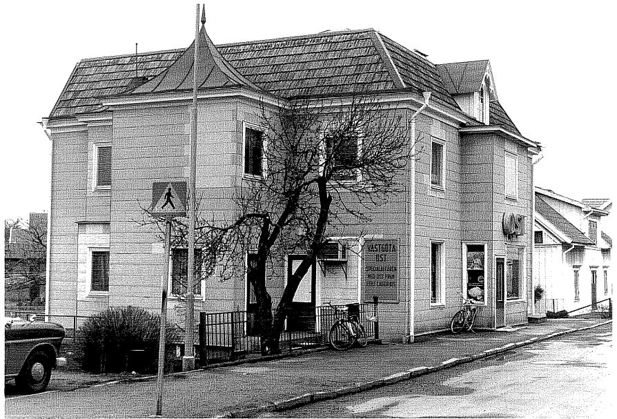
Bostadshus a fr.SÖ, 5:19.

Ödeshög sn Gripen 6 Smedjegatan 8 foto:M.Wikdahl,1978.