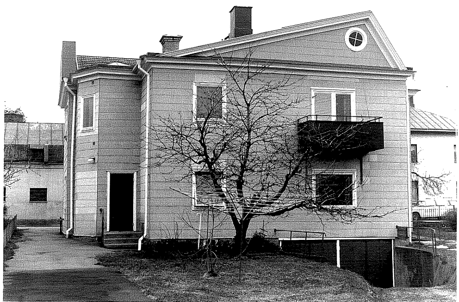
Bostadshus a fr. V, 5:17.